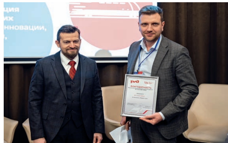
«Тольяттиазот» получил благодарность Куйбышевской железной дороги в номинации «Прорыв года»

Конкурс на предприятии проводят впервые, и лучших сотрудников назвали в номи-