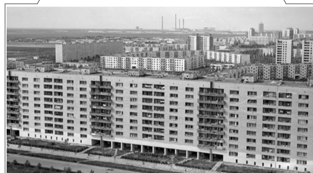
МАГАЗИН 1000 МЕЛОЧЕЙ

Продолжаем цикл публикаций, посвящённых 45-летию завода. Если 1973 и 1974 годы для «Тольяттиазота» можно считать этапами предварительного планирования и согласования проектов, то в 1975-м к делу приступили всерьёз. Создали штаб стройки, готовят площадки под приём оборудования, обеспечивают транспортную доступность. В тот же сезон много знаковых событий происходит в городе, области, стране и мире.