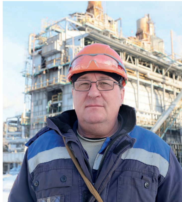
На мирной службе

– В выходные после приборки, когда корабль стоит на рейде, экипаж отдыхает на